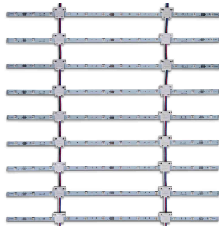
Lichtquelle LED-Vorhang Verwendung vorwiegend bei grossen Formaten