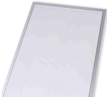
Plexiboard mit Laserpunkten Verwendung vorwiegend bei kleinen bis mittleren Formaten

Asuntec LED-Rahmen sind in DIN-Grössen und auch nach Mass erhältlich. Je nach Typ und Grösse werden als Lichtquelle entweder Lichtflächen Plexiboards oder LED-Vorhänge verwendet.